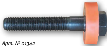
Арт. № 01342