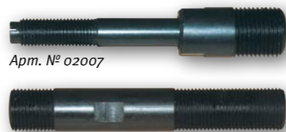
Арт. № 02007