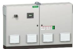
VLVxF4P 1200 x 1600 x 400