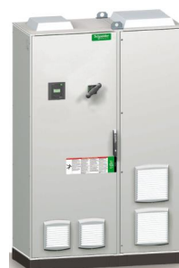
2200 x 1400 x 600