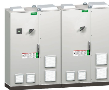
VLVAF8P (2 шкафа VLVAF6P)