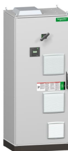
2200 x 800 x 600