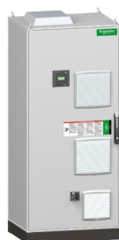
2000 x 800 x 600