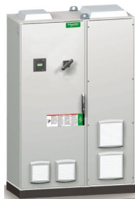
VLVAF6P 2200 x 1400 x 600