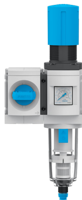
Стандартная комбинация MS6-EMFR...-B

Ищете стандартное решение ? Тогда устройство MS-Basic прекрасно подходит: например, это может быть готовый блок подготовки воздуха в составе из клапана подачи/сброса давления с ручным управлением и фильтр-регулятором.