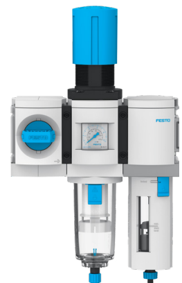
Решение с расширенными функциями MS6-EMFR...-B + MS6-LF

Фильтр-регулятор LFR-B доступен со встроенным манометром или присоединением 1/8", например, для круглых манометров.