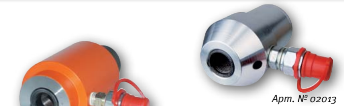
Арт. № 02013