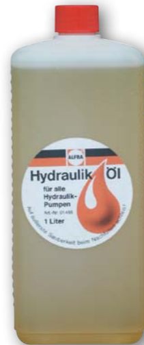
Арт. № 01455

Внимание: при заправке гидравлических агрегатов следует соблюдать абсолютную чистоту!