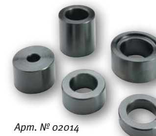
Арт. № 02014