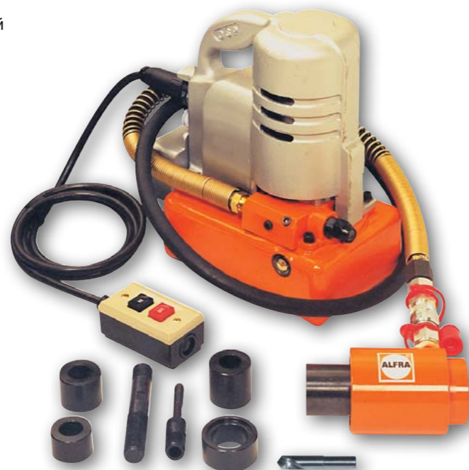
Арт. № 02025