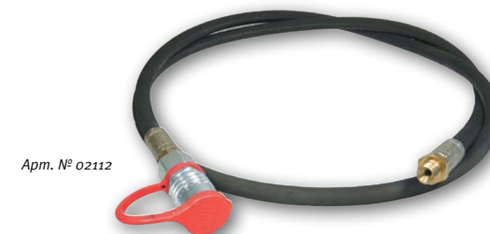
Арт. № 02112