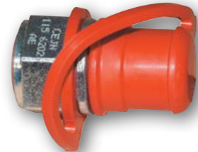
Арт. № 01453