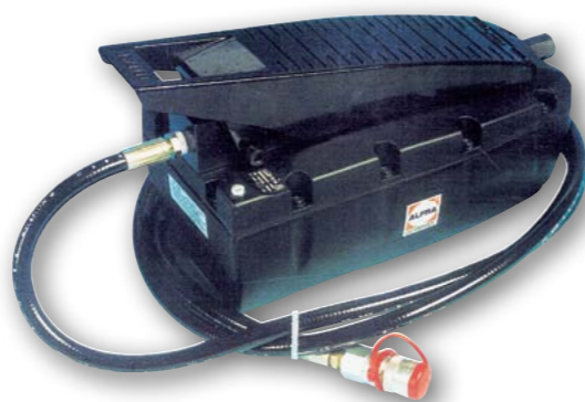
Арт. № 02140