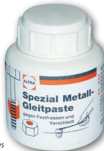
Арт. № 33005

Обязательно использовать при работе с листовыми штампами посредством гаечного ключа.