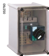
Щиток местного секционирования с выключателем-разъединителем Interpact на токи 40 – 630 А