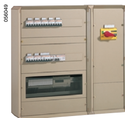
Распределительный щит с вводным выключателем-разъединителем Interpact на токи 40 – 160 А

Вводной выключатель в распределительном щите административного здания