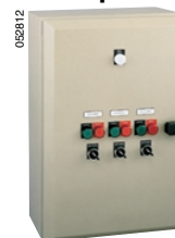
Шкаф автоматики с вводным выключателем-разъединителем Interpact на токи 63 – 400 А