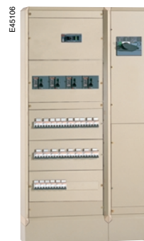
Силовой распределительный щит с вводным выключателем-разъединителем Interpact на токи 400 – 2500 А